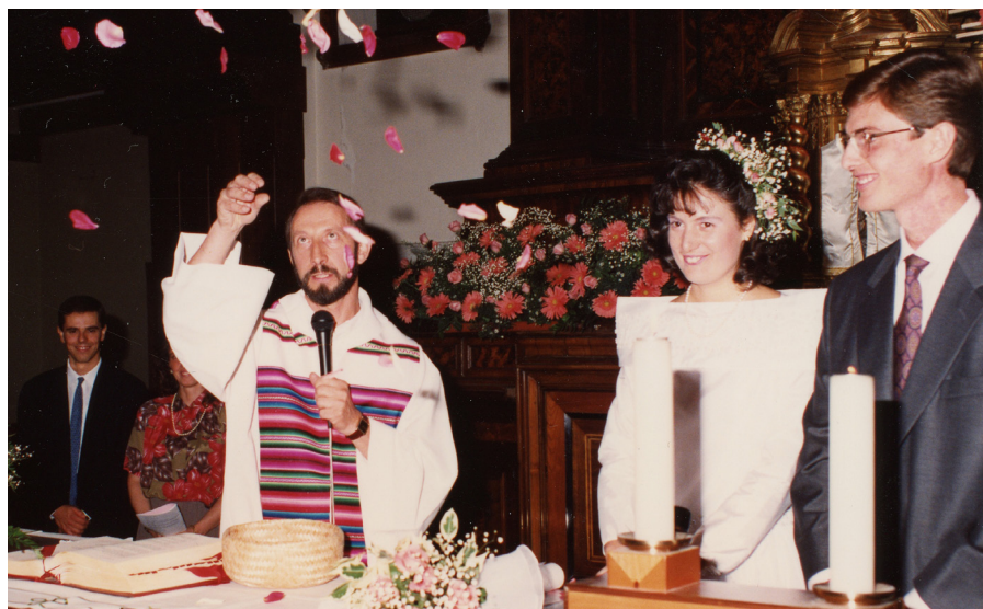
Celebrazione del Sacramento del Matrimonio.

“Sapeva suscitare preziose collaborazioni per dare vita a progetti sia di celebrazione che di educazione catechistica, sperimentare formule nuove nel dire la fede ad adolescenti e giovani.”