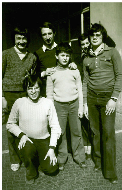
Con i suoi primi ragazzi nella casa salesiana di Trento

“La mitezza, ... è una delle qualità che don Guido ha mostrato nella propria vita, accogliendo lo Spirito di Gesù e sforzandosi, con serena umiltà, di corrispondervi.”