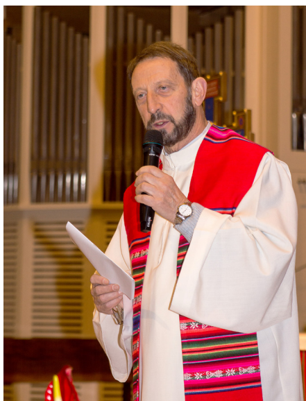
Belluno chiesa San Giovanni Bosco. “E la bellezza del cuore significa ordine interiore, armonia delle parti, equilibrio delle forze ma, soprattutto, percezione d’un Amore che, solo, appaga ogni desiderio di vita”