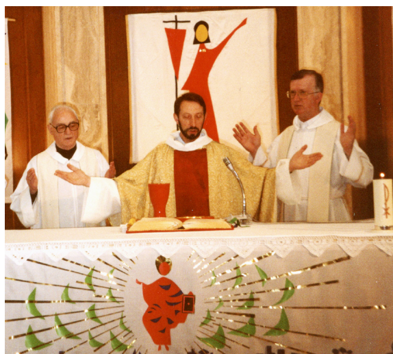
Istituto Salesiano “Tusini” di Bardolino (Vr). Celebrazione.

“... l’impegno verso il mondo dei preadolescenti, con la stessa preoccupazione di trovare, anche a partire dalla tradizione della Chiesa, i modi per dire loro parole di vita.”