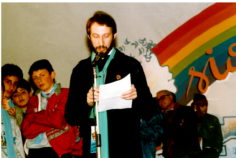
Animazione ispettoriale: festa dei Ragazzi a Schio “... si diffuse allora una risonanza che lo portò ad allestire le celebrazioni più impegnative e solenni”