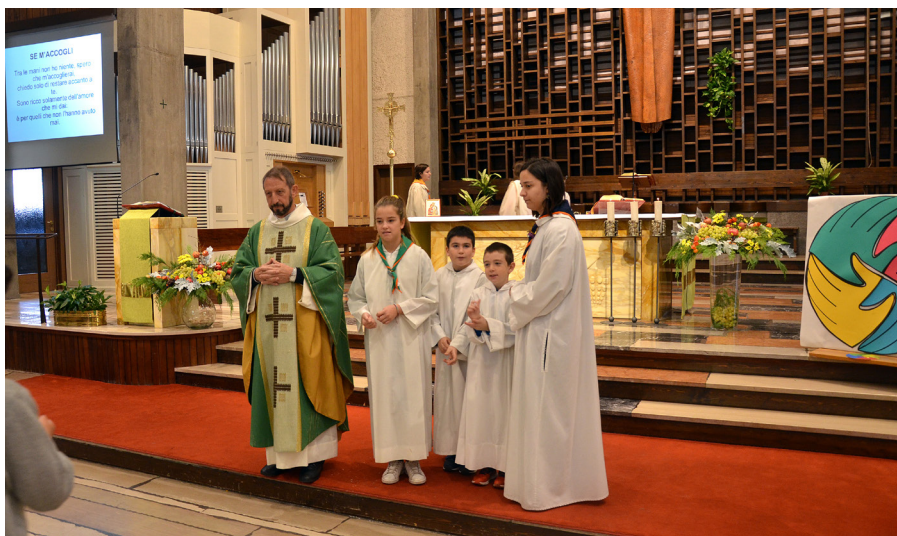
Belluno, chiesa San Giovanni Bosco.

“... l’impegno verso il mondo dei preadolescenti, con la stessa preoccupazione di trovare, anche a partire dalla tradizione della Chiesa, i modi per dire loro parole di vita.”