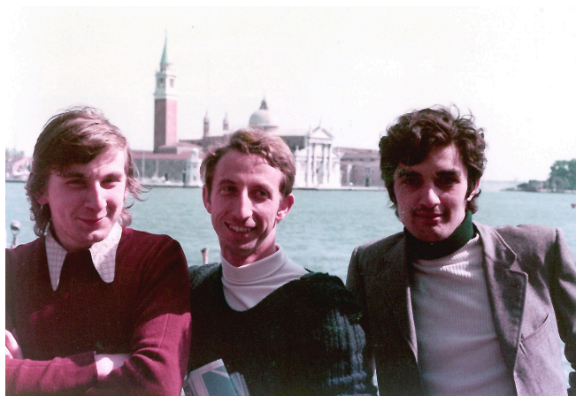
A Venezia con i compagni di studi.

“Aveva un cuore da pastore: la sua pazienza, il suo silenzio, la sua gentilezza, la sua vicinanza...”