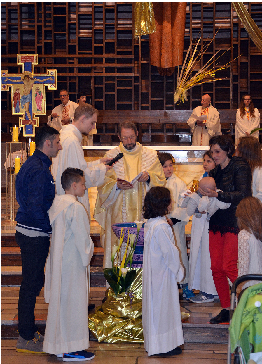
Belluno, battesimo nella chiesa di San Giovanni Bosco. “La bellezza a servizio del rito, della celebrazione, della preghiera.”