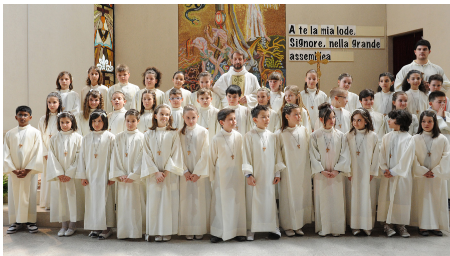
Verona, Parrocchia Santa Croce.

“Sapeva suscitare preziose collaborazioni per dare vita a progetti sia di celebrazione che di educazione catechistica, sperimentare formule nuove nel dire la fede ad adolescenti e giovani.”